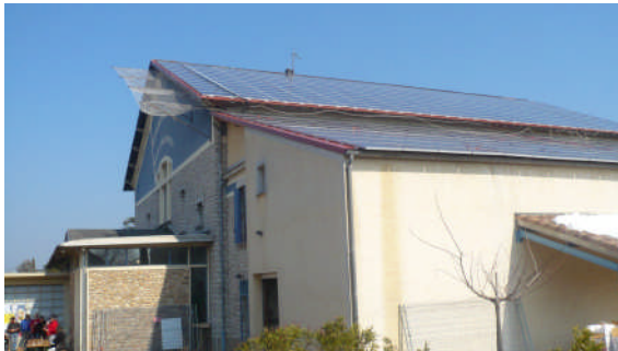
Panneaux photovoltaïques sur le toit de la cave coopérative de Massillagues-Atuech

Le développement économique ne doit pas nuire à l'environnement et doit prendre en compte la problématique de la ressource en eau