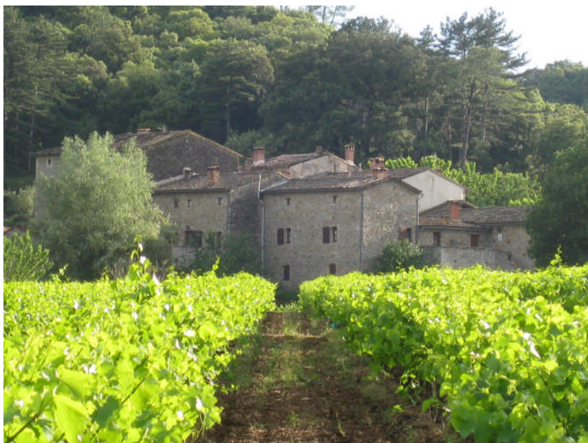
Un hameau de Tornac

La commune d'Anduze représente 34% de la population totale et regroupe 41% des plus de 60 ans du territoire et 44% des plus de 75 ans.