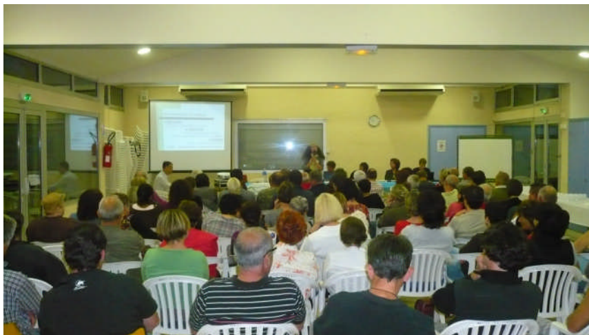
Présentation aux élus et au personnel administratif et technique des communes. Cardet le 10 juin 2010

Au départ, il est à noter que deux séminaires devaient être réalisés par le Cabinet FIDES Conseils. Or, devant le nombre important d'interrogations, un troisième séminaire s'est tenu.