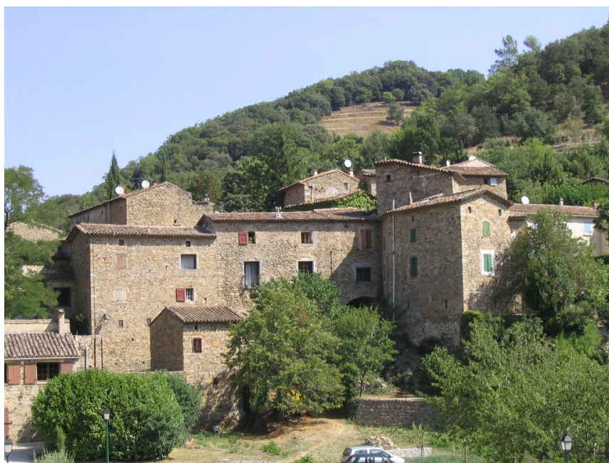
Un hameau de Saint Sébastien d'Aigrefeuille