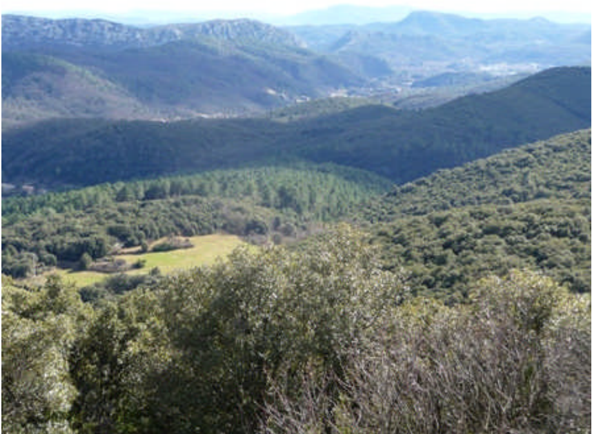
Vue sur la Porte des Cévennes

Trois séminaires ont été nécessaires pour avoir une vision claire et partagée : les élus s'étant prononcés pour le renforcement de la cohérence territoriale appuyée sur la logique de vallée.