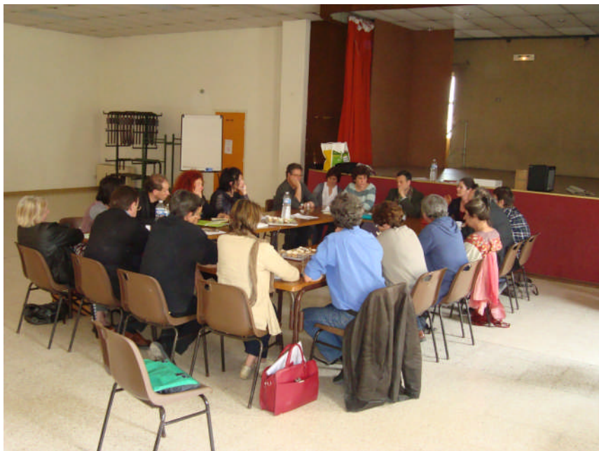
Comité Technique de Suivi

Il s'agit d'organiser le soutien et l'appui au développement d'un point emploi- lieu ressources d'AOD offres et demandes (Ricochets) qui accueille déjà d'autres permanences (ADAEC, CEDIFF, Raison de plus...). Le lieu ressources pourrait accueillir la MLJ (mission local Jeunes). L'idée est d'inscrire cette action sur l'ensemble du territoire de la communauté de communes avec une plus large diffusion de l'information. Dans un premier temps, une convention entre AOD et la communauté permettrait de rendre l'action plus lisible.