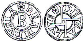
Une monnaie locale au 12ème siècle : le denier d'Anduze

La mise en place d'une telle expérience nécessite plusieurs étapes et en premier lieu, une réunion publique pour expliquer le mode de fonctionnement. Elle pourrait se tenir à la rentrée de septembre et se poursuivre par une décision d'action collective et la création d'un groupe de travail pour une mise en place en 2011.