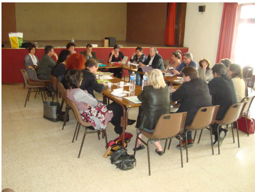
Comité Technique de Suivi

Cela nécessite de lister les appartements vacants à louer sur l'intercommunalité. Les objectifs de cette action sont de favoriser l'accès au logement que ce soit en propriété ou en location et de permettre d'être très bien logé (logement sain, environnement de qualité) à toutes les catégories de la population (familles, jeunes, etc.).