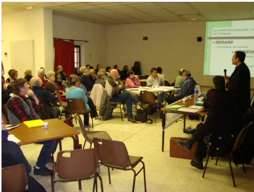
1ère assemblée de territoire « le Regard » (23 janvier 2010)