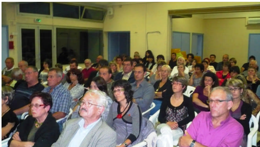
Présentation du projet de territoire aux élus des communes et à l'ensemble du personnel administratif et technique des communes et de l'intercommunalité, le 10 juin 2010 au foyer communal de Cardet.

Ces trois séminaires ont montré l'attachement des élus communautaires à la Communauté de Communes Autour d'Anduze en renforçant sa gouvernance (huit pôles en délégation) et en mobilisant ses compétences dans son projet de territoire : vision à quinze ans qui s'inscrit dans l'esprit et la lettre de la réforme territoriale qui s'annonce.