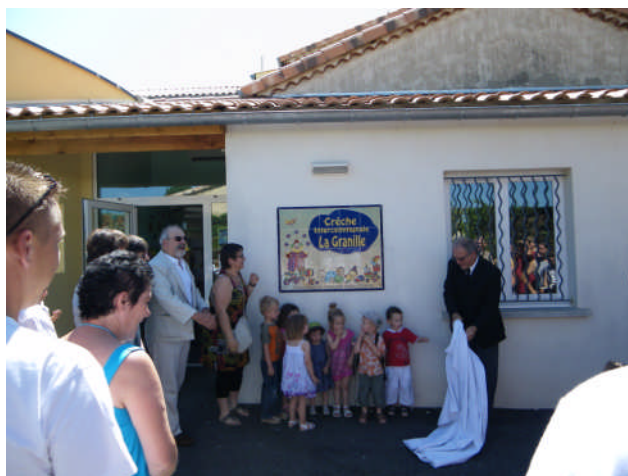
Inauguration de la crèche les « Granilles » à Ribaute les Tavernes (13 juin 2009)

Les structures existantes sont un atout (Centre Médico Psychologique, Centre Médico Social, structures d'emploi et d'insertion, et associations caritatives...). Cependant il manque une vision et une cohérence globale et territoriale. Cette compétence étant actuellement assurée par les communes, la Communauté de Communes Autour d'Anduze a peut être un rôle à jouer sur l'ensemble du champ de l'action sociale.