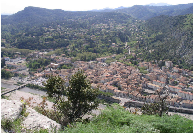
Anduze vue de Peyremale

Une partie de la population vit sur le territoire avec des revenus modestes, conséquence acceptée d'un style de vie choisi. Ces personnes-là sont parfois porteuses de projets.