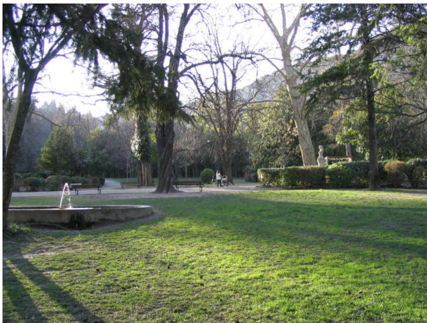
Le Parc des Cordeliers à Anduze

Il s'agit d'utiliser des clauses applicables dans le cadre des appels d'offres locaux : critères sociaux, environnementaux, dans la production et la transformation des produits, dans leur distribution (circuits courts locaux) dans le cadre des appels d'offres pour les cantines scolaires.