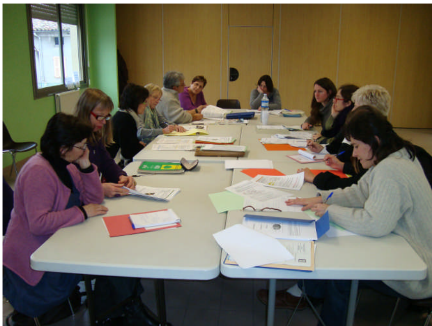
Groupe de travail en assemblée de territoire (6 mars 2010)