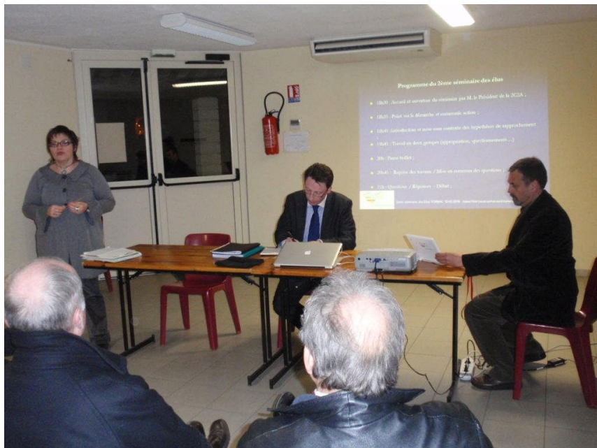
Séminaire des élus

Ce dernier séminaire d'élus riche en échanges et en débats a permis de valider le principe d'un scénario conjuguant le maintien et le renforcement de la Communauté de Communes Autour d'Anduze, tant dans son périmètre que dans ses compétences et d'acter la nécessité de rapprochements thématiques avec les territoires périphériques par le prisme d'ententes sur des compétences communes.