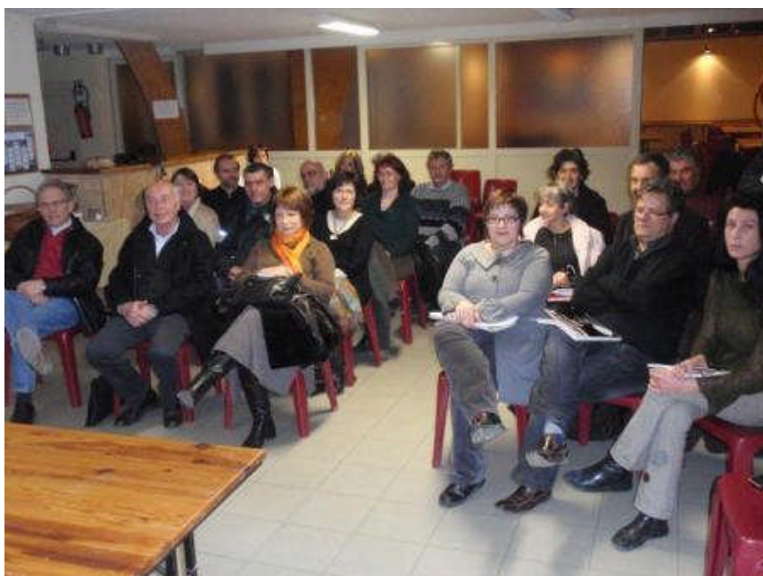
Séminaire des élus le 12 février 2010