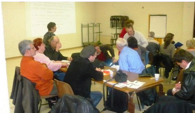
Assemblée de Territoire du 6 mars 2010