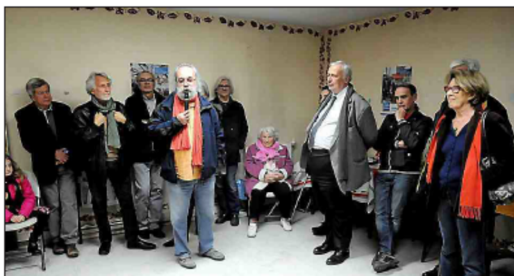
■ L'émotion, teintée d'amertume et de tristesse, était palpable lundi soir.